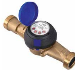
Рис. 2 Лічильник води JS