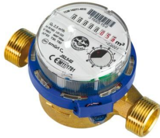
Рис. 3 Лічильник води JS