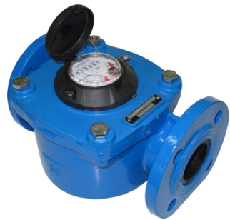
Рис. 2 Лічильник води JS