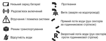
Рисунок 5.2 – Дисплей лічильника