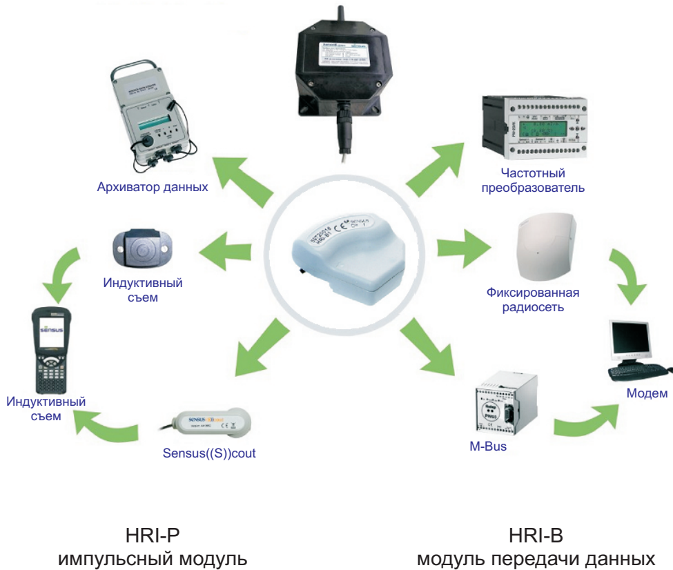
HRI-P импульсный модуль