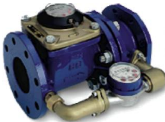
Рис. 1 Лічильник води MWN / JS-S